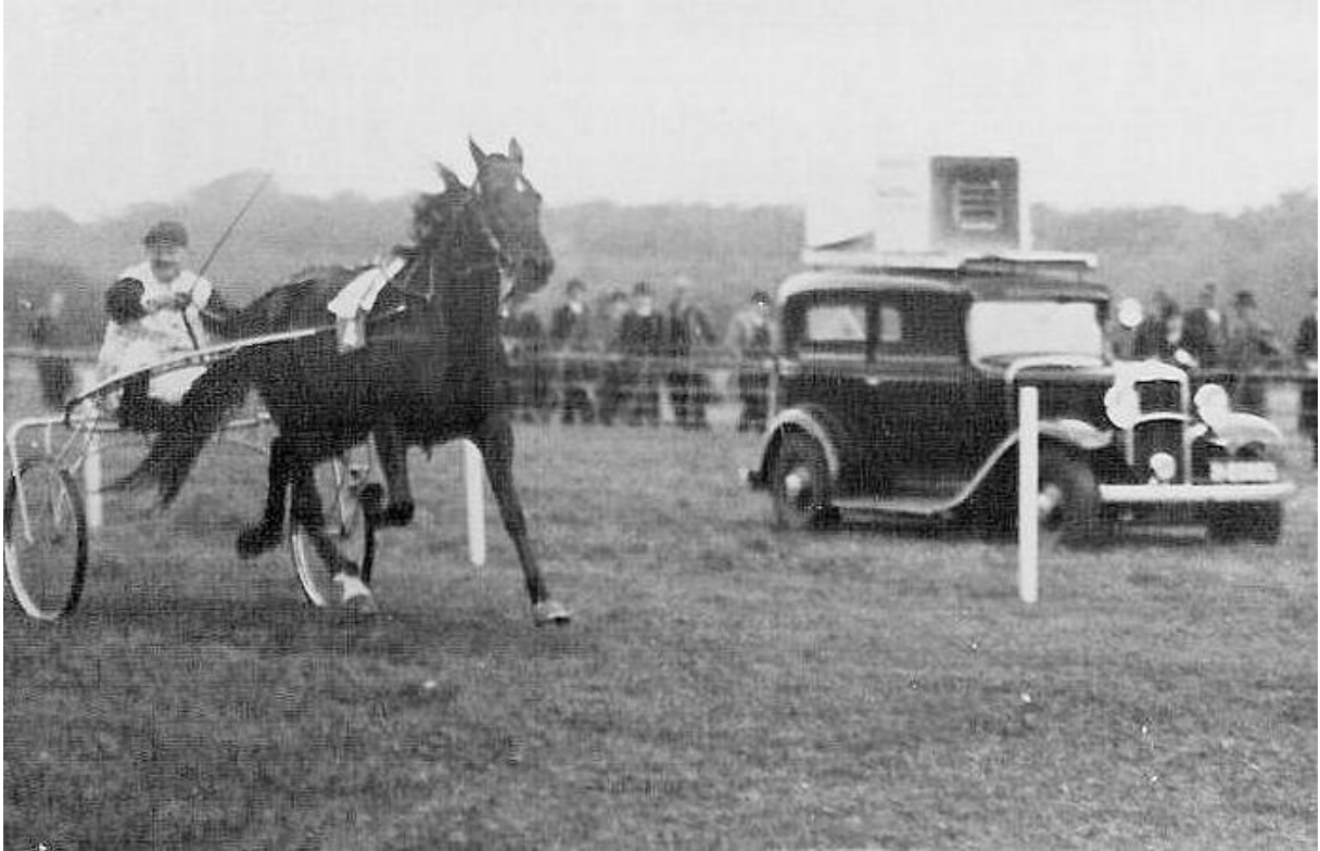
Boven: Roel van Wieringen wint hier met zijn grote crack Xerxes in de jaren 30.